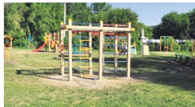
Благодаря проекту «Наведем порядок!» в Верхнем Уфалее появилась новая детская площадка.