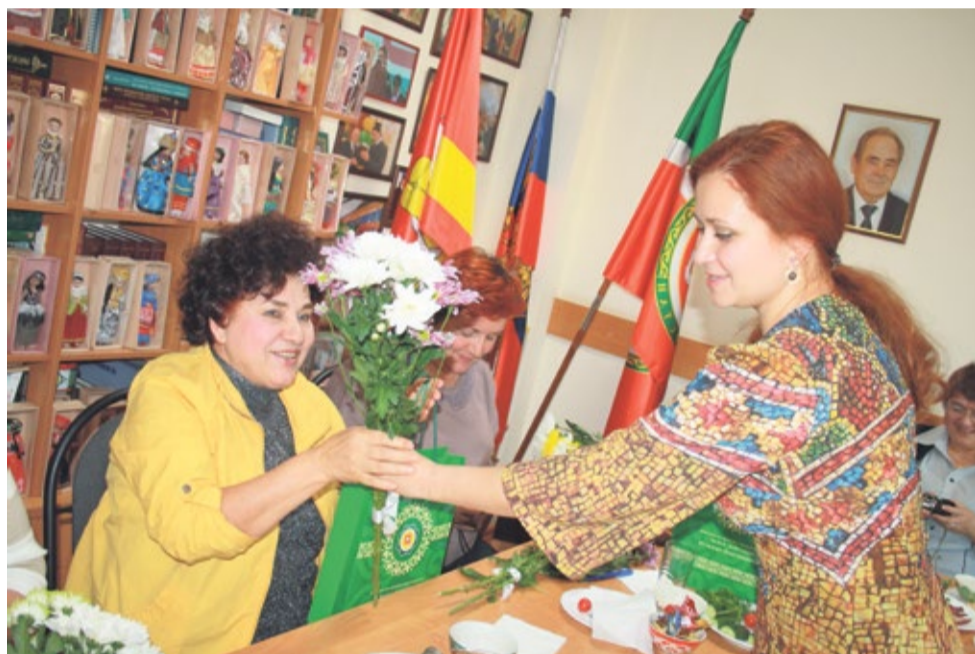
Все участники встречи получили памятные подарки и услышали теплые слова благодарности

конкурсе «Учитель года», а в следующем году стала обладателем гранта губернатора Челябинской области.