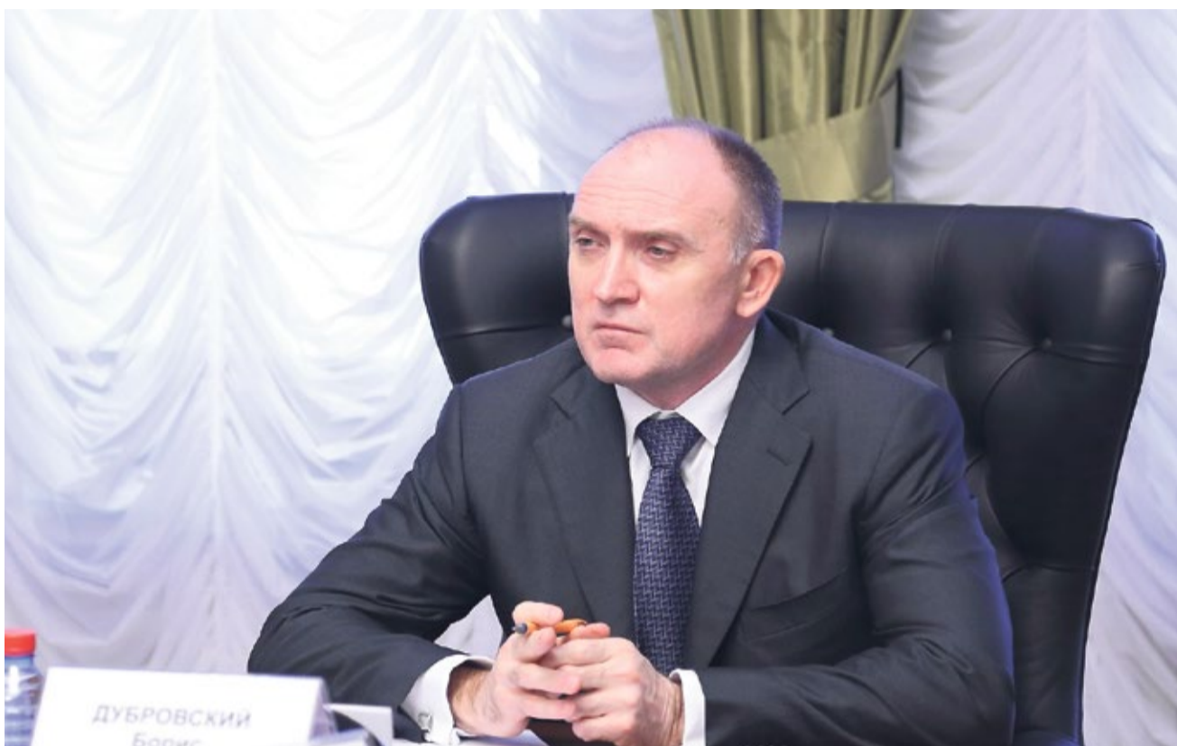
Борис Дубровский: «С рассуждениями о том, что народ не приспособлен к чистоте, я не согласен!»

Октябрь на Южном Урале – месяц субботников. Порядок на улицах и во дворах наводят жители больших и малых городов. Многие искренне считают это своим долгом. Вместо того чтобы бесконечно сетовать на чью-то безответственность и неаккуратность, они берут в руки метлы и грабли и проводят «генеральную уборку». Областные власти боевому настрою южноуральцев только рады. Ведь чистота в городе, как и в квартире, – общая забота.