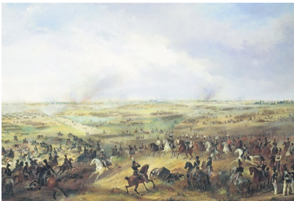
"Битва под Лейпцигом", картина работы А.И. Зауервейда