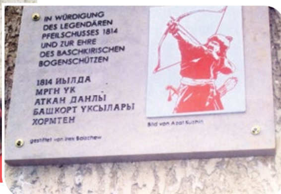
Мемориальная доска в Лейпциге