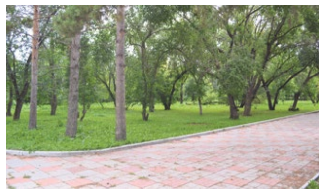
И чисто, и красиво – так преобразился Привокзальный парк в Верхнеуральске.

Обратить внимание властей на территорию, срочно нуждающуюся в благоустройстве, достаточно просто: заходим на сайт gubernator.74.ru, потом по ссылке на страничку рубрики, заполняем форму, прикладываем фотографию – и все. Сам факт обращения – уже гарантия того, что просьба или предложение будут рассмотрены. А дальше дело за муниципальными властями. Ведь именно им предстоит «прини-