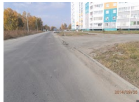
Было и стало – найдите 5 отличий. Курчатовский район г. Челябинска.