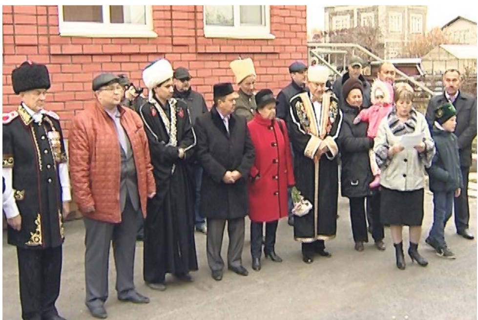
Праздник прошел хоть и скромно, но очень душевно и торжественно