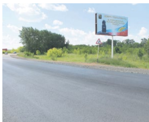
Въезд в город Коркино после реконструкции

деланная уже городскими или районными службами – своеобразный отчет о том, что «меры приняты».